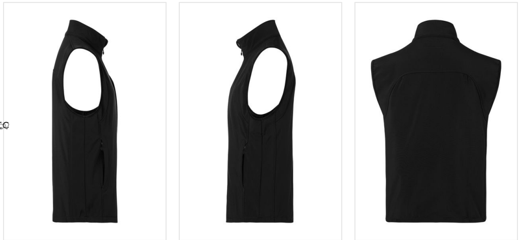
WM 4 Men's Softshell Waistcoat