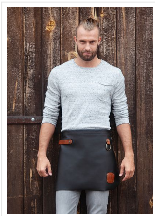
VS 8 Leather Waist Apron