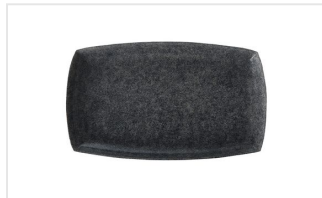
1818024 Inlegger BASKET