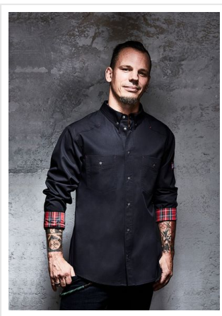
RCJM 16 Chef Shirt, Button-D