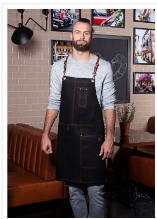
LS 25 Bib Apron Urban X-Style