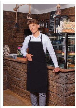
LS 34 Bib Apron Teneriffa