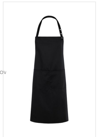
LS 34 Bib Apron Teneriffa