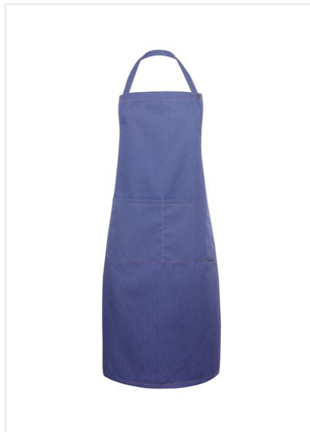
LS 22 Bib Apron Jeans-Style