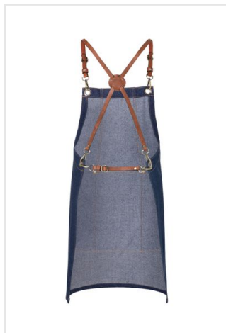
LS 28 Bib Apron Denim X-Style