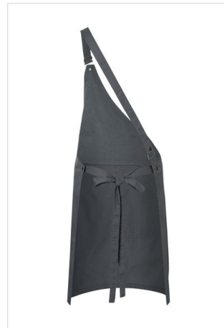
LS 36 Asymmetrical Bib Apron Cla